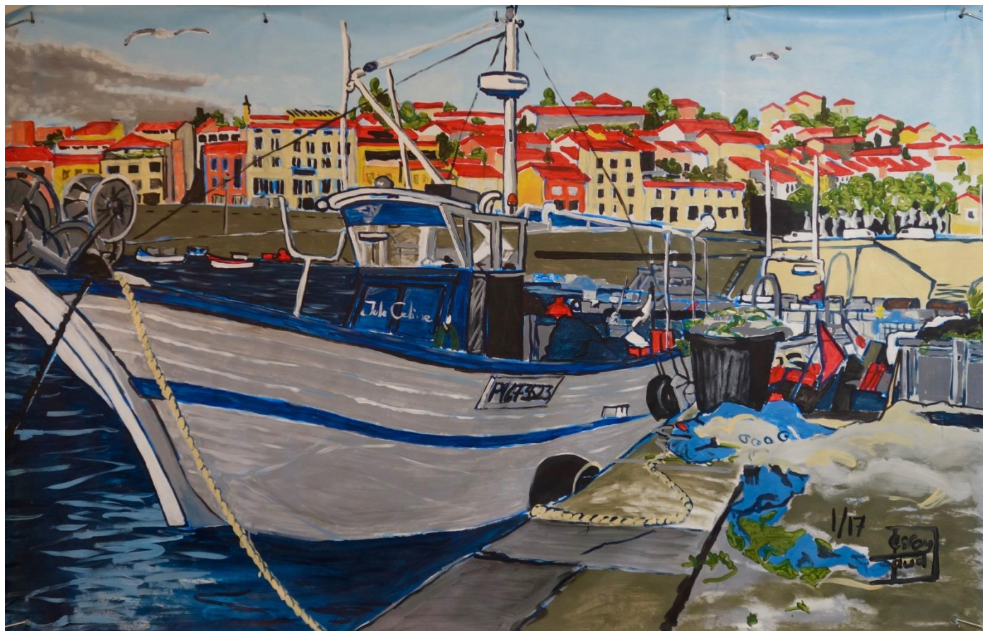
Jules et Céline, acrylique sur toile cirée, 2,10 m X 1,40 m